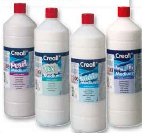
Textilní medium 1000 ml Perleťové medium 1000 ml Sticker medium 1000 ml Multimedium 1000 ml

VYTVOŘTE SI SAMI Z OBYČEJNÝCH TEMPEROVÝCH BAREV SPECIÁLNÍ BARVY A ŠETŘETE SVOJE NÁKLADY