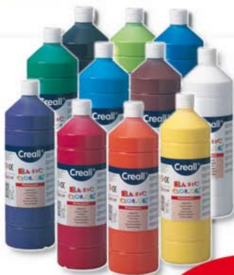
Temperové barvy 500 ml, v mnoha odstínech