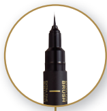
EXTRA FINE BRUSH